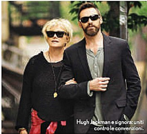
Hugh Jackman e signora: uniti contro le convenzioni.