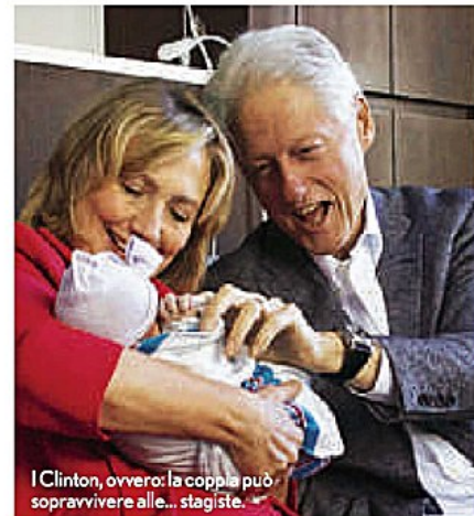
I Clinton, ovvero: la coppia può sopravvivere alle... stagiste.

perdonato il tradimento e lui si è fatto da parte lasciandole la scena politica. La loro unione si basa sul fatto di avere visioni di vita e obiettivi molto chiari, e sull'essere disposti a fare sacrifici per realizzarli. IMITA LA COPPIA! Se vuoi una relazione duratura, preparati a capire le ragioni di eventuali "intoppi", a perdonare e ad andare oltre. Occhio, però: se state sempre insieme e avete pochi spazi individuali, a lungo andare potreste soffrire di calo del desiderio. Come evitarlo? Trascorrete più tempo con gli altri, trovate dei hobby personali e, di tanto in tanto, introducete una novità nei vostri tête-à-tête.